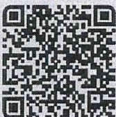
สิ่งที่ส่งมาด้วย

กรมส่งเสริมการปกครองท้องถิ่น มิถุนายน ๒๕๖๕