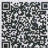
QR Code แบบสำรวจ